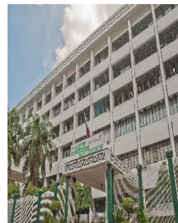
라살대 본관 건물